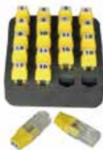
網路ID遠端識別器 ID 1-20 P/N : RK220