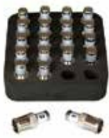
同軸ID遠端識別器 ID 1-20 P/N : RK120