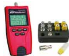
P/N : T119K1