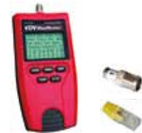
P/N : T119C